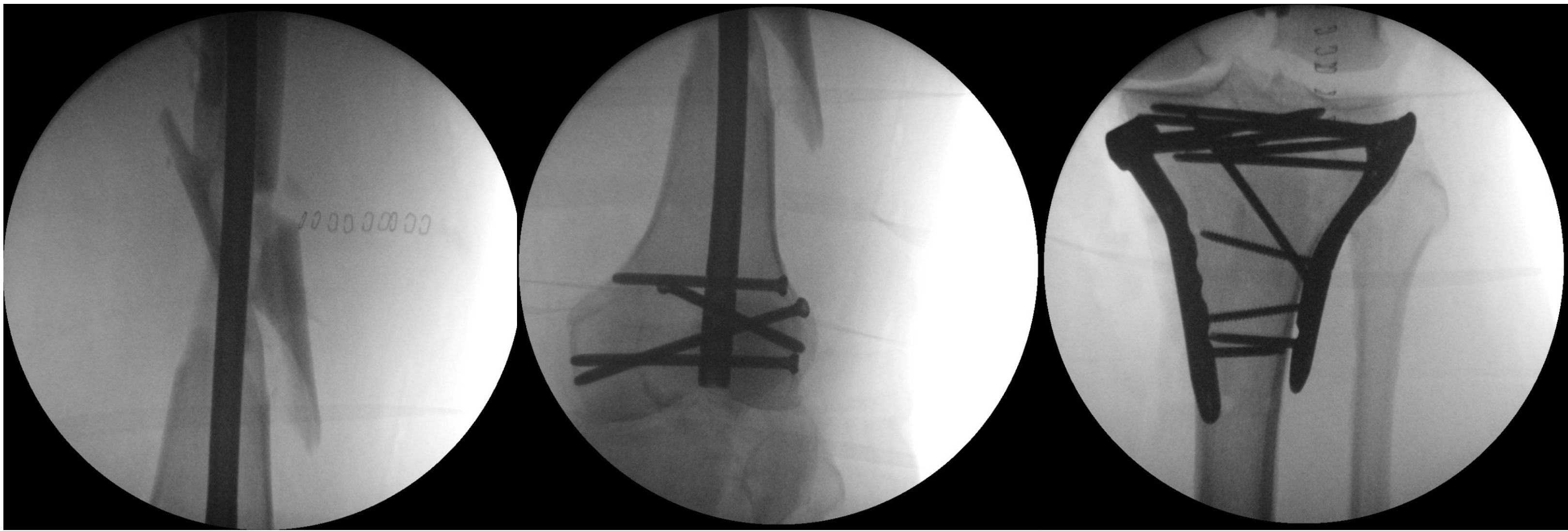
Osteosíntesis definitiva (+5días): clavo retrógrado de fémur y doble placa en meseta tibial.