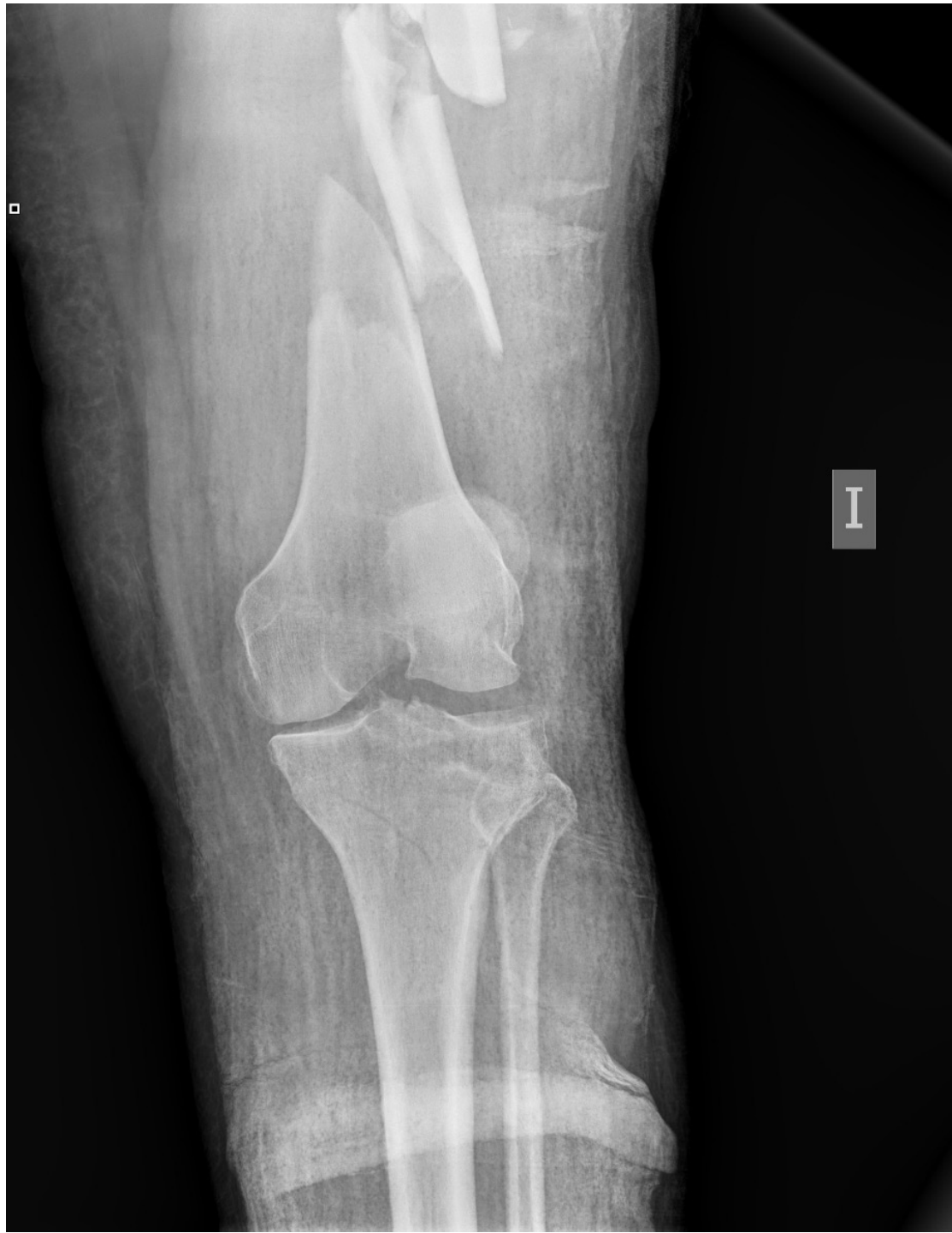
Rx MII: fractura diáfisis bifocal de fémur (32-C2 AO/OTA); fractura de meseta tibial (41-C2 AO/OTA)