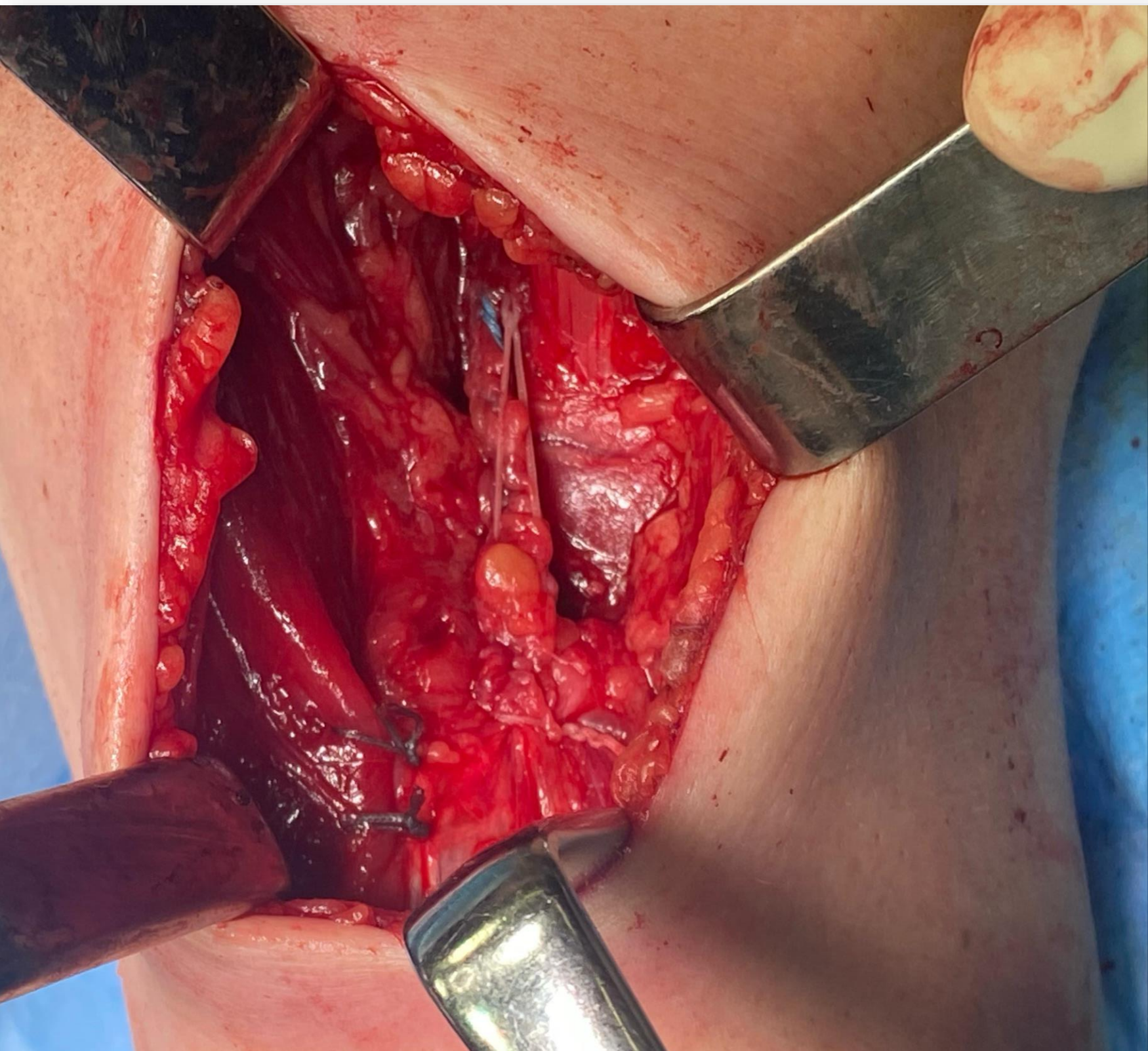
Imagen 2 postoperatoria