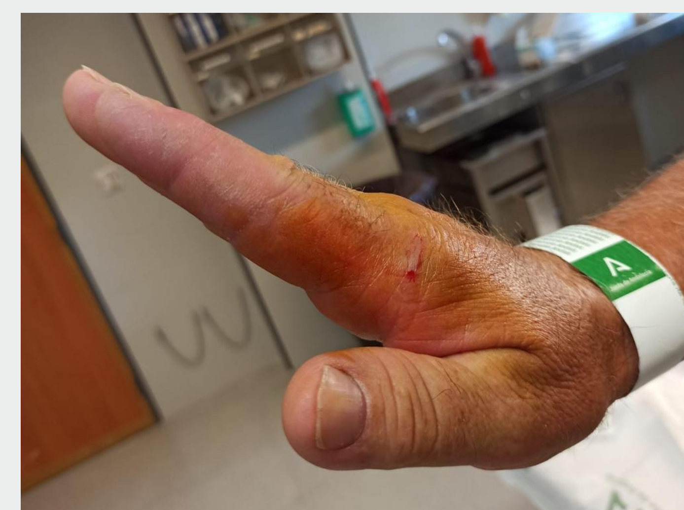
Fig 3. Extensión completa tras reducción cerrada