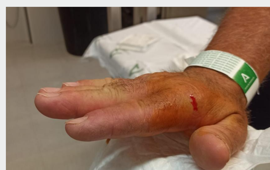
Fig 1 y 2. Déficit de extensión 20° previa reducción

Se objetiva bajo escopia osteofito de cabeza segundo metacarpiano como causante del bloqueo