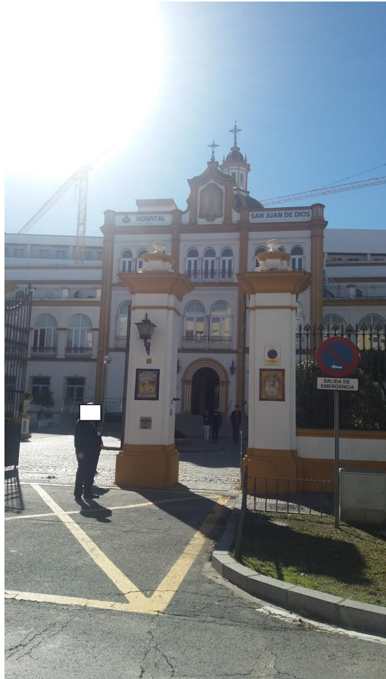
Imagen actual del Hospital SJD de Sevilla