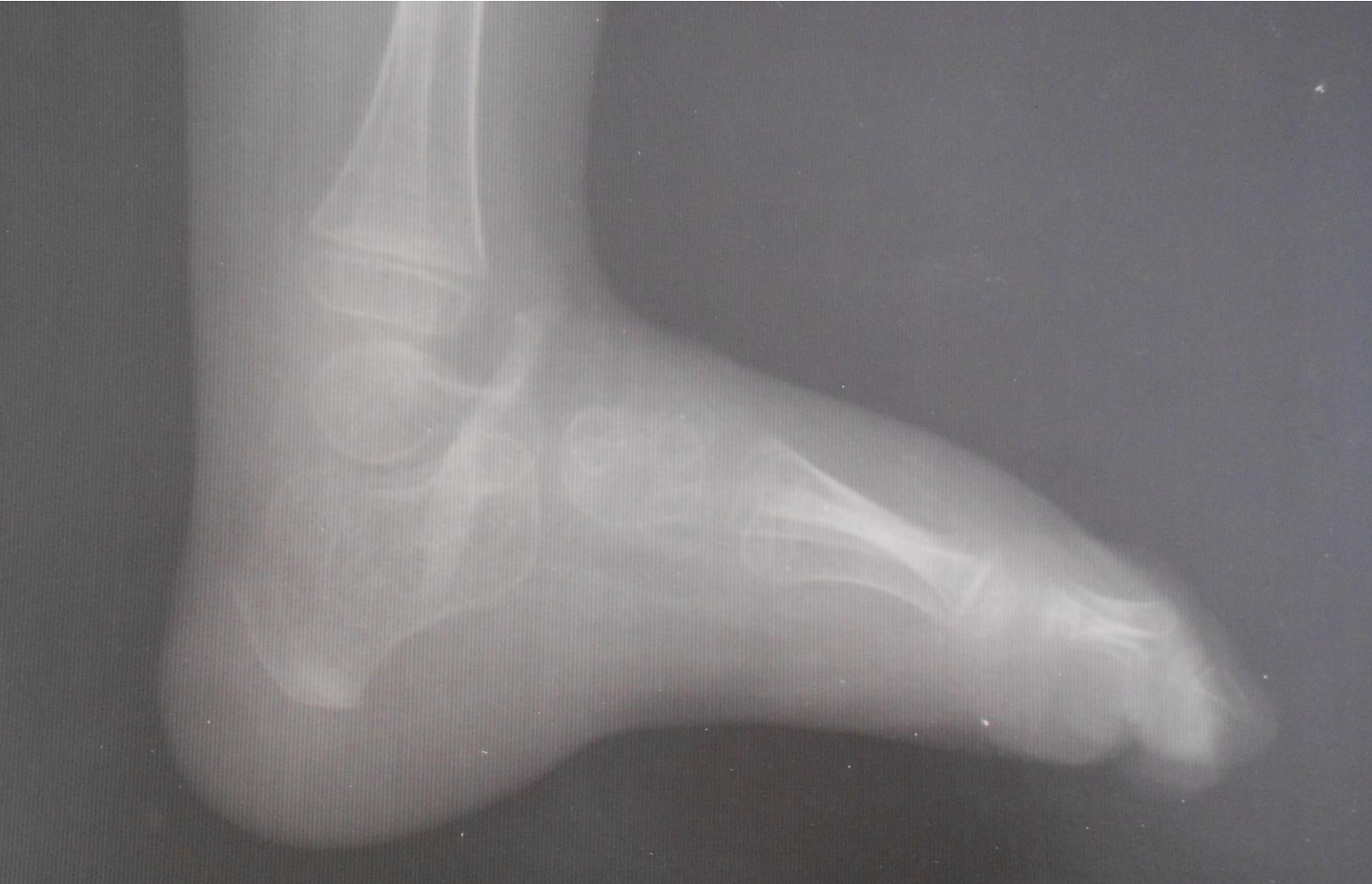
Imagen de un pie intervenido por secuela de parálisis infantil mediante injerto costal subtalar

Histograma de diagnósticos según clasificación CIE actual recogidas de las historias del Hospital San Juan de Dios de Sevilla (años 1943-1950): 1(Mal de Pott) 2(TBC extrarraquídea) 3(poliomielitis) 4(raquitismo) 5(Littel) 6(malformaciones)