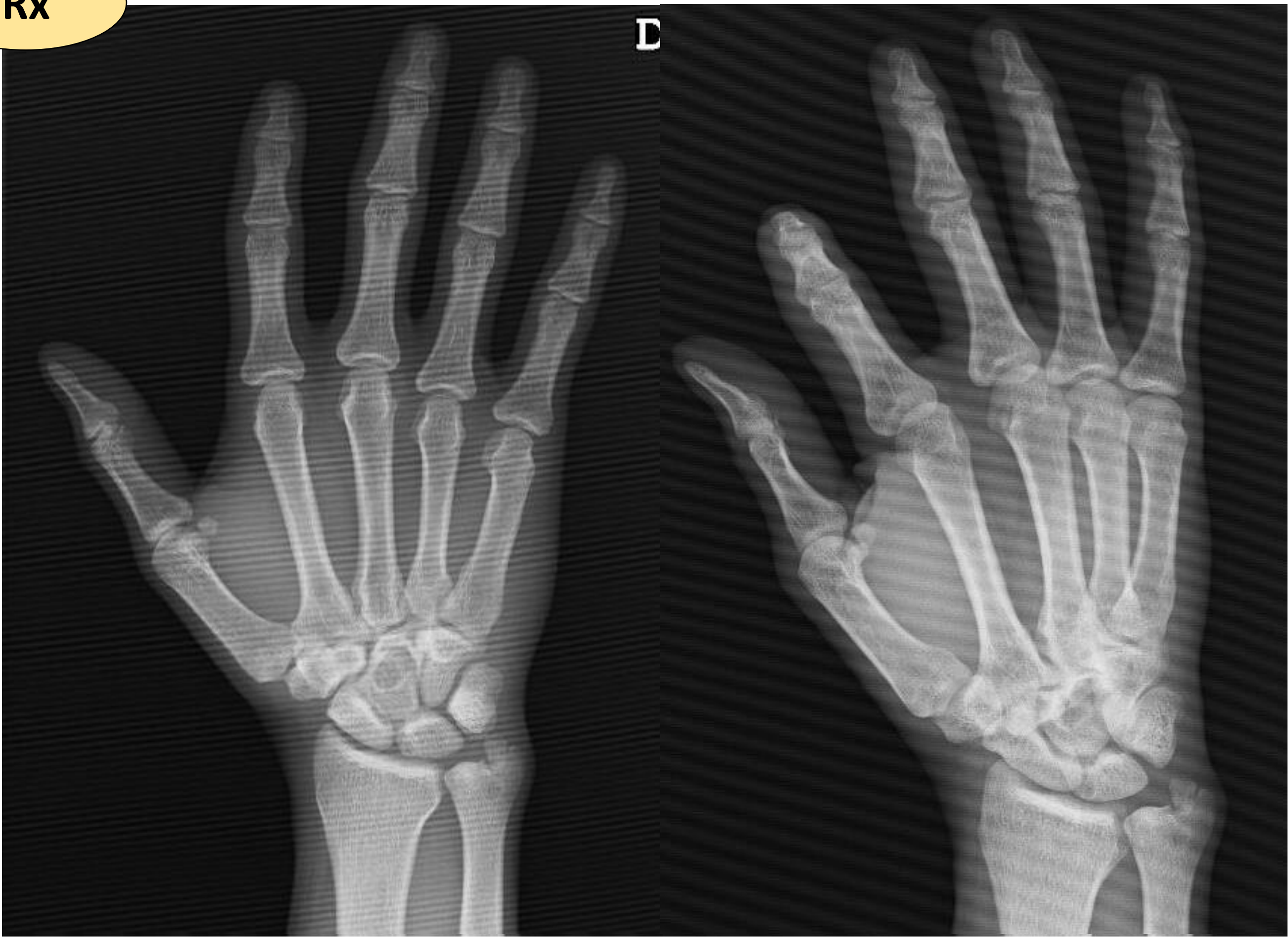
Imagen 1: lesión lítica en hueso grande.