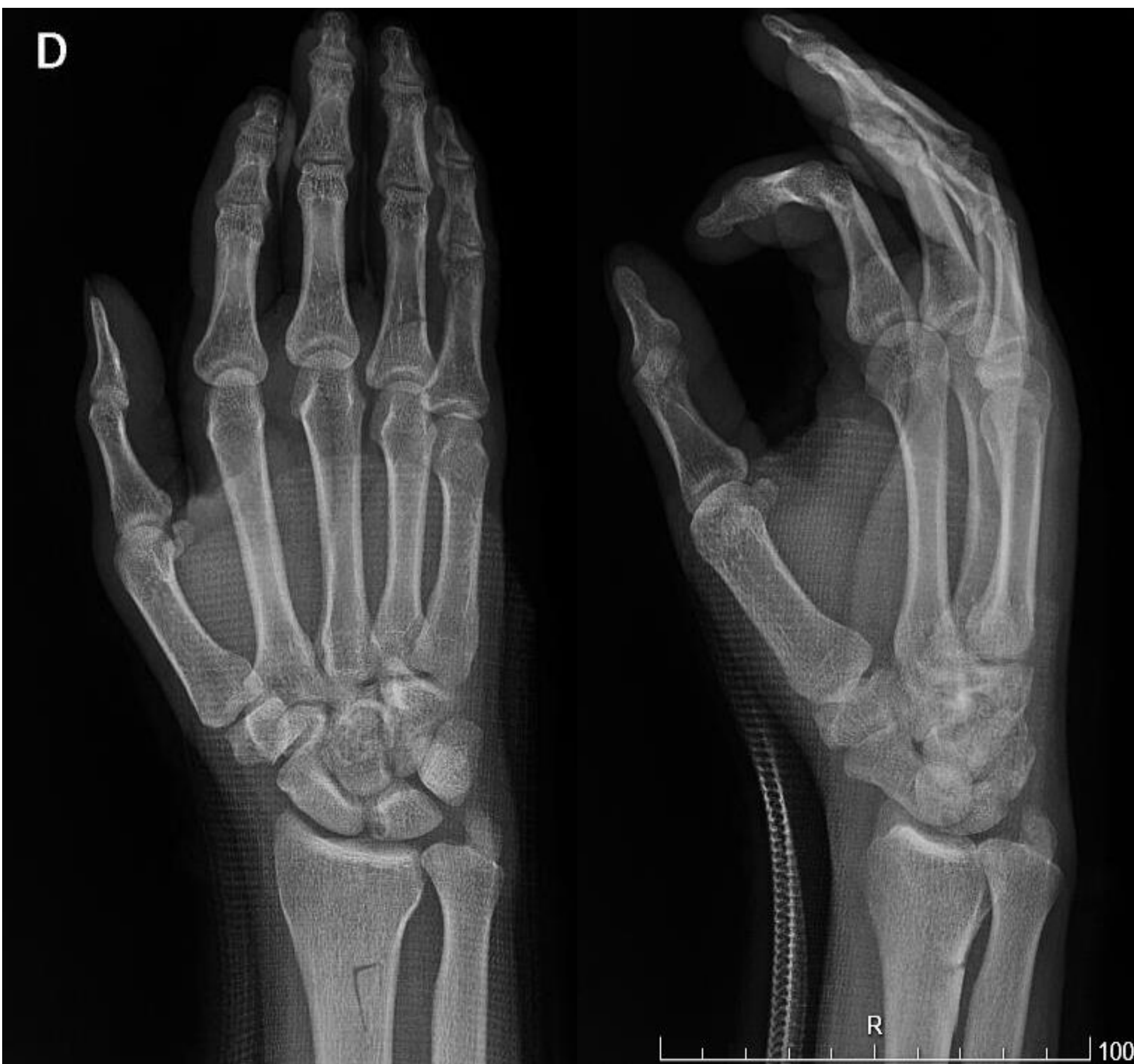
Imagen 3: control radiológico postoperatorio.

El TCGVS es una patología benigna aunque agresiva, cuya sintomatología puede ser inespecífica, por lo que requiere un alto grado de sospecha y un diagnóstico y tratamiento precoz mediante una resección en bloque, con el objetivo de minimizar la tasa de recidivas.